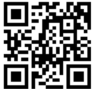
"Crazy" Bewegungsablauf Bridge